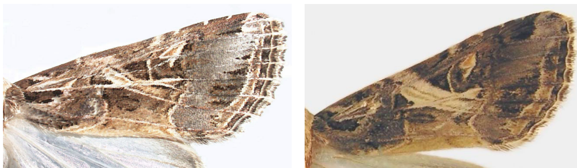
شکل ۱- بال جلویی S. litura (سمت راست)، بال جلویی S. littoralis (سمت چپ)

بیشترین میزان شکار توسط تله طعمه‌گذاری شده با فرومون جنسی S. exigua با میانگین روزانه ۶/۵۸ شب پره نر S. exigua و کمترین میزان شکار توسط تله طعمه‌گذاری شده با فرومون جنسی S. littoralis با میانگین روزانه ۲/۷۴ شب پره نر به ثبت رسید.